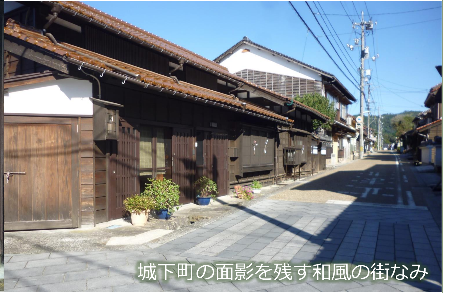
城下町の面影を残す和風の街なみ