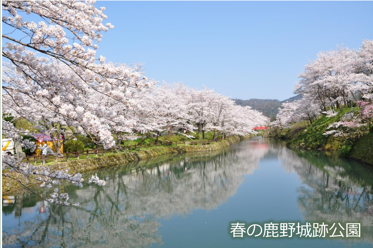
春の鹿野城跡公園