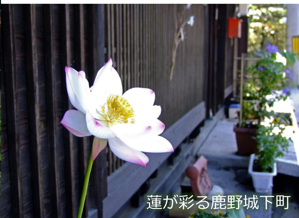
蓮が彩る鹿野城下町