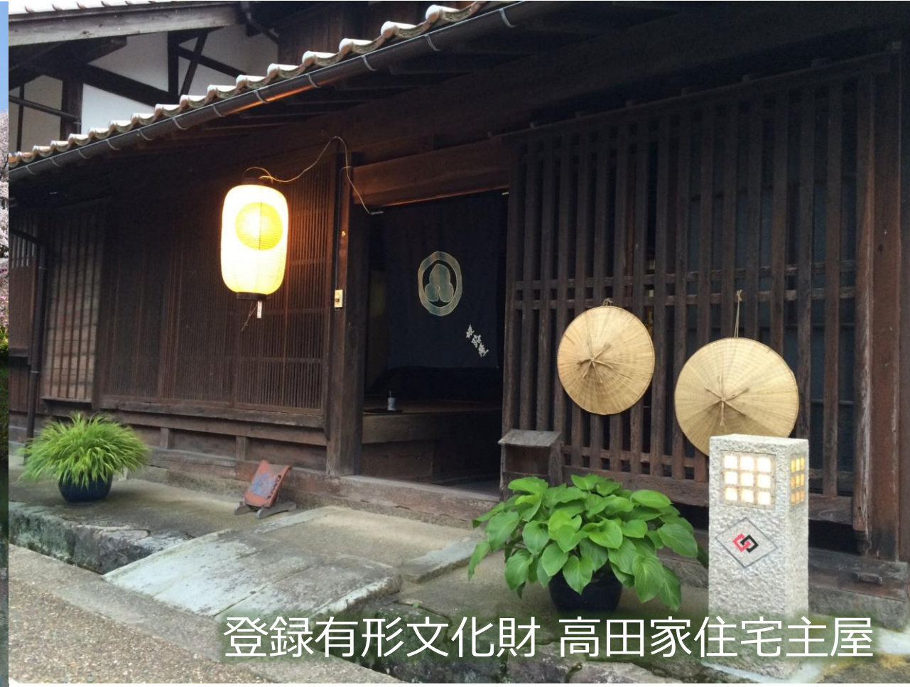
登録有形文化財 高田家住宅主屋