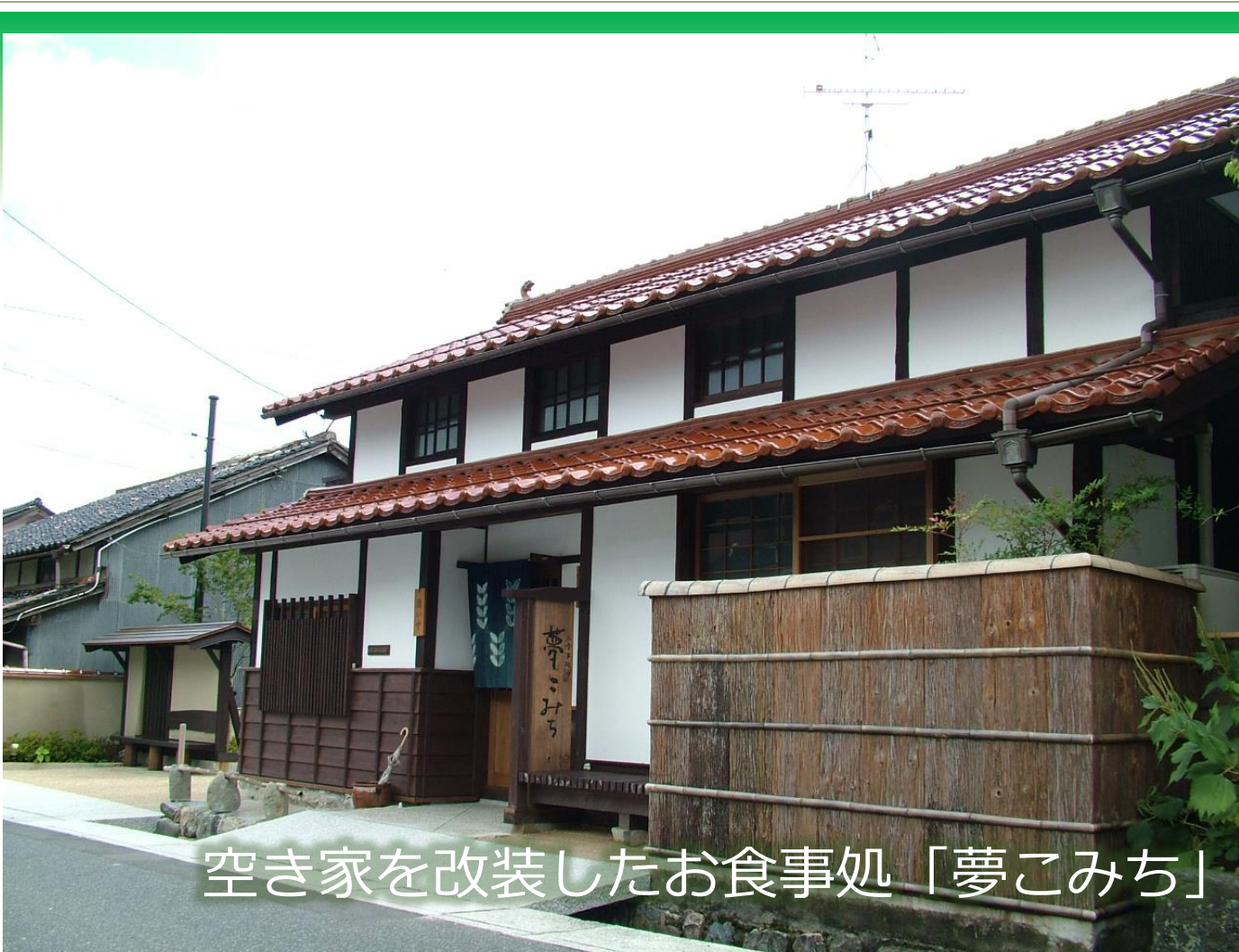
空き家を改装したお食事処「夢こみち」