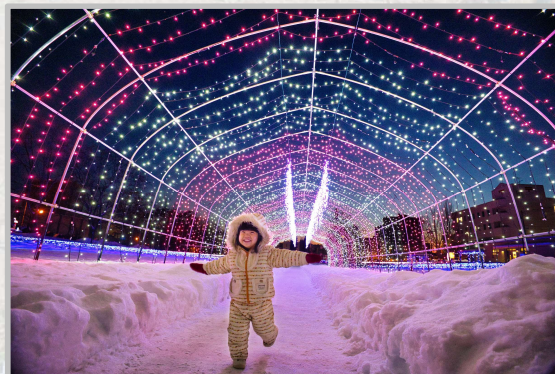
第6回 一般部門 グランプリ「わーい」