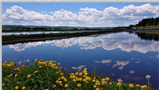
第5回 デジタルコース グランプリ「田水張り」